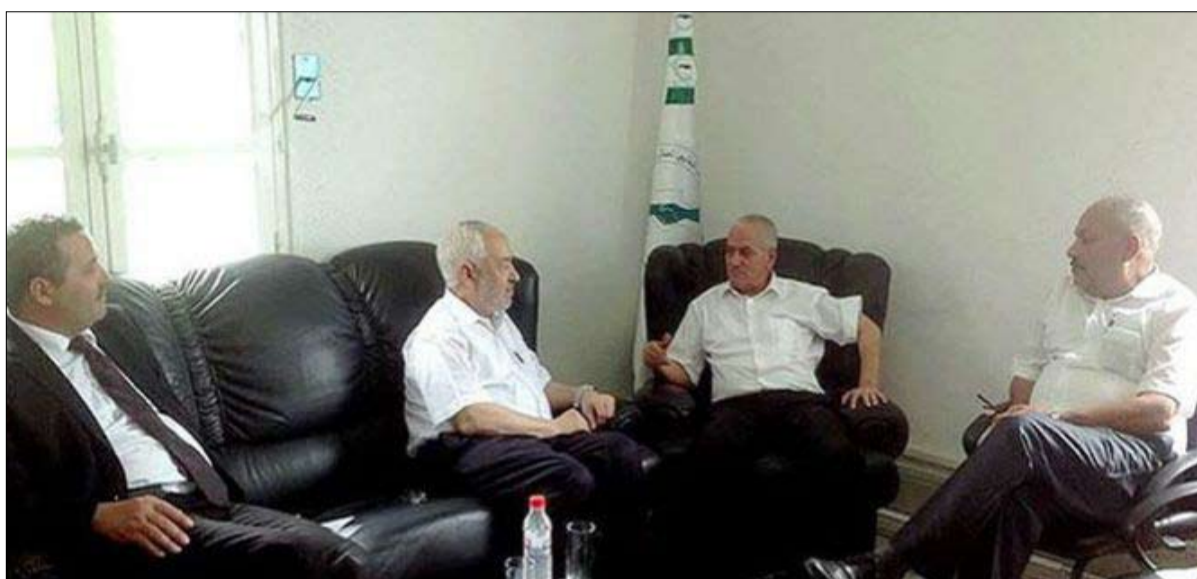
موائد حوار تلد أخرى

إصرار المعارضة هذا، يقابله إصرار مماثل من طرف حركة النهضة في عملية لي ذراع مفتوحة مرشحة للاستمرار طويلا إذا لم يفلح