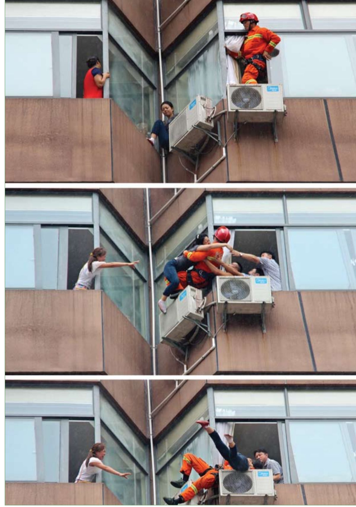
رجل إطفاء ينقذ امرأة حاولت الانتحار من نافذة الطابق السابع بفندق في تونغرن بمقاطعة قويتشو الصينية بسبب مشاكل عائلية.

قبضت قوات الأمن السعودية على متسولة عند أحد التقاطعات الرئيسية في محافظة الدمام بعد الاشتباه في وضعها، بحسب موقع جريدة الشرق. وبالتحقق من هوية المتسولة، تبين أنها شاب سعودي في عقده الثاني يتنكر في زي امرأة لاستعطاف المارة. وقد أحيل الشاب إلى مركز الشرطة لاستكمال الإجراءات اللازمة في حقه. وتشن السلطات السعودية حملة كبيرة لمحاربة ظاهرة التسول السيئة. ويتم التحفظ على المقبوض عليهم والمضبوطات التي عثر عليها بحوزتهم وتحريزها بشكل محكم. كما يجري تسليم كل من ضبط وهو يتسول لمركز الشرطة لاستكمال الإجراءات اللازمة تمهيداً لتسليمهم لجهة الاختصاص.