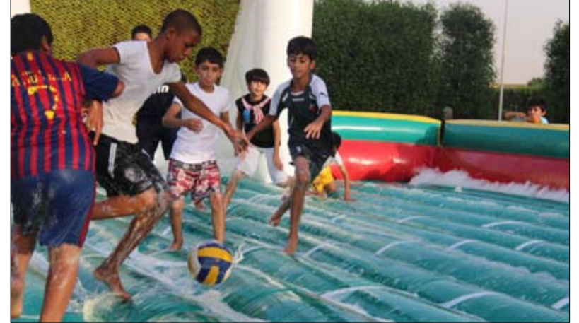
إقبال على الأنشطة الشاطئية في سيف بلادي