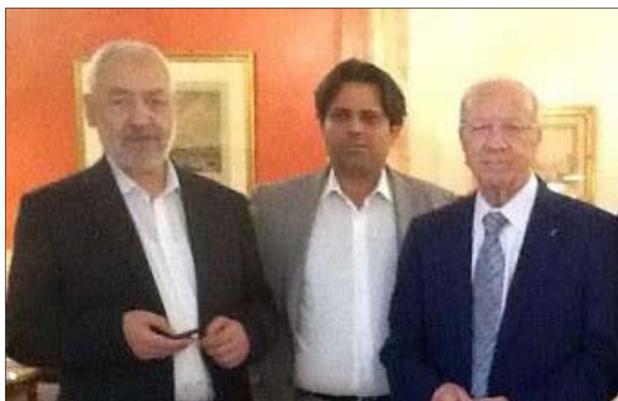
•• الفجر - تونس - خاص:

مرة أخرى تأتي التصريحات فضفاضة تتسم بالعمومية، وتحتمل المواقف العلنية فيها المعنى وضده. كان ذلك بعد لقاء انتظره التونسيون، جمع أمين عام الاتحاد التونسي للشغل حسين العباسي برئيس حركة النهضة راشد الغنوشي ودام أكثر من أربع ساعات.